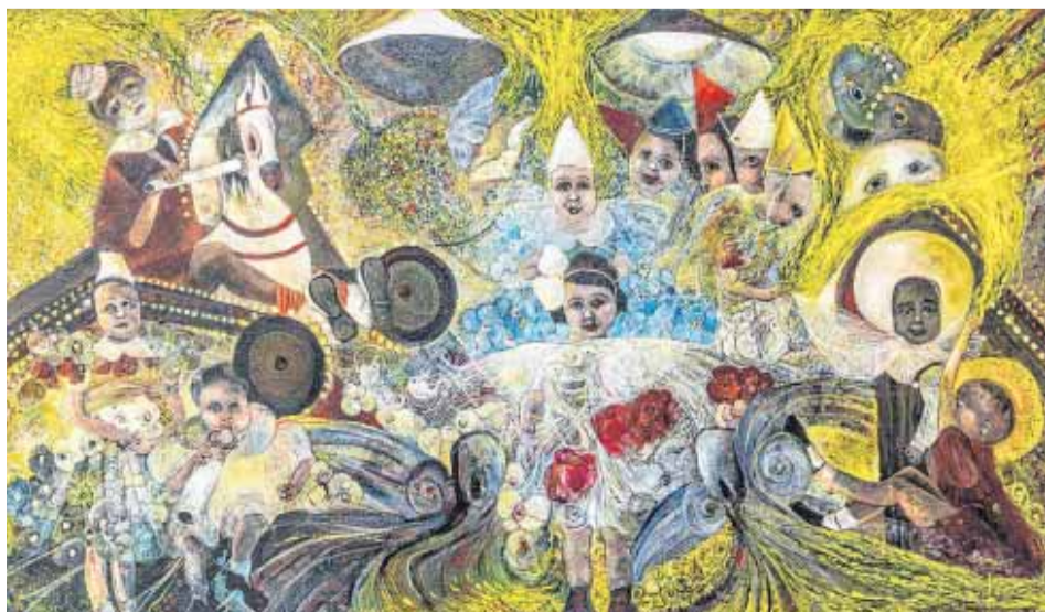
"CHILDREN, ANGELS, Saints and Ghosts", 2017, acrílico sobre lienzo, 52 x 90 pulgadas.