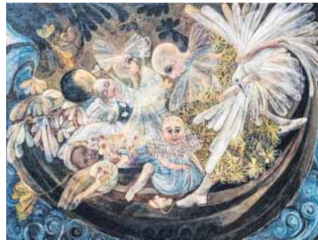
"THE CATCHER", 2016, acrílico sobre lienzo, 46 x 60 pulgadas.

escena donde coexisten diferentes dimensiones y temas recurrentes de la historia del arte (El Edén, el Ángel caído, el retrato de familia, la Pietá). La máscara que actúa como suerte de línea del horizonte y desdoblamiento del yo, es puente entre las dimisiones que abarca esta pieza cuyo intrincado procedimiento -por adición y substracción- en capas y motivos que proliferan por doquier, obliga al espectador al salto constante del ojo sobreexcitado sobre la superficie.