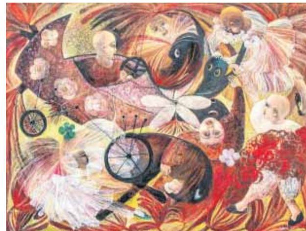
"CUBAN GÜJES and Children", 2014, acrílico sobre lienzo, 46 x 60 pulgadas.

La muestra incluye también Boticelli's Garden (2017), Offering to Goddess Flora (2020) y Light versus Darkness (2020-2021), exquisitas piezas en las que temas recurrentes de la historia del arte se convierten en clave para la liberación personal de la artista y de cada uno de los espectadores que se aventuren a